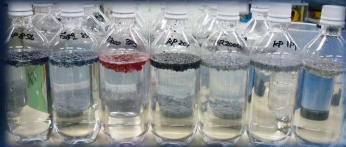
水系塗料各種（自動車ボディー用）のマルチ処理状態